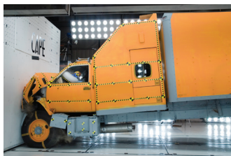
Choque de barrera asiento