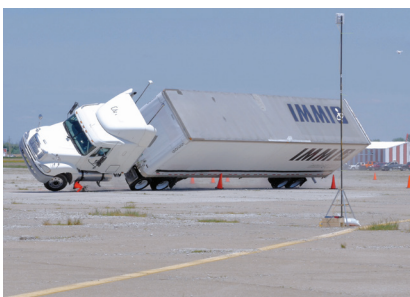
Prueba de rodadura al aire libre

Nuestros hallazgos han llevado a avances significativos en seguridad para la industria y los hombres y mujeres que la impulsan.