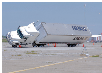
Test de renversement extérieur

Nos découvertes ont conduit à des avancées significatives en matière de sécurité pour le secteur et les hommes et les femmes qui le font progresser.